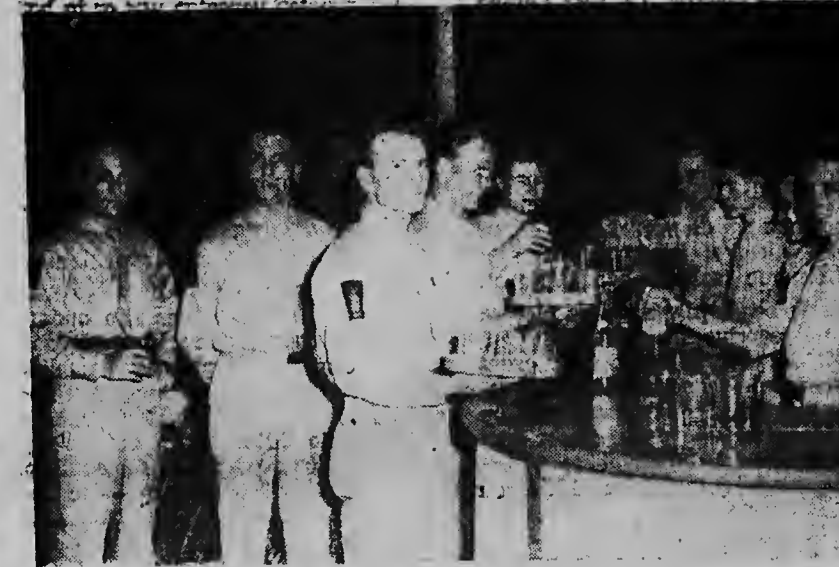
Een schare mariniers zorgden dat het de gasten aan niets te kort kwam. Een woord van hulde voor deze mannen is dan ook volkomen op zijn plaats.

Gemeld wordt dat er ter hoogte van de Chinese Club een man op de weg lag met een bloedende wonde aan zijn hoofd. Bij aankomst van de politie trof deze ter plaatse de bekende M.K. aan die een wond aan zijn mond had. Hij verklaarde te zijn geschopt door een zekere A.K. M.K. is voor eerste hulp overgebracht naar een dokter. Een verder onderzoek wordt ingesteld.